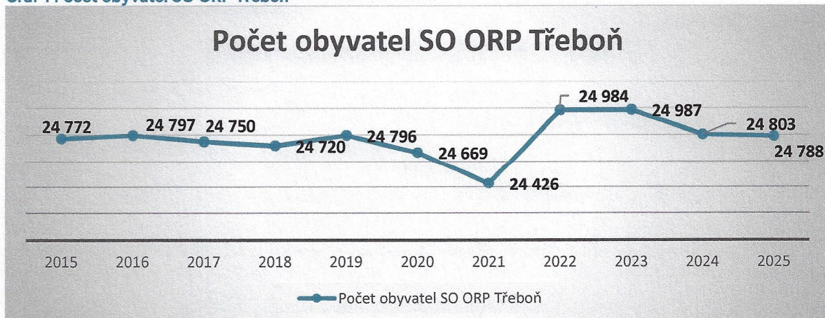
Graf 1 Počet obyvatel SO ORP Třeboň

Pozn. Data za rok 2025 jsou uvedena k 30.9.2025.