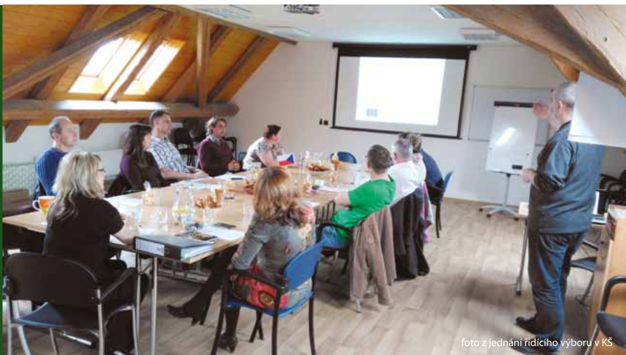
foto z jednání řídicího výboru v KŠ

V POSLEDNÍ DOBĚ SE DO SLOVNÍKŮ ŘEDITELŮ A ŘEDITELEK MATEŘSKÝCH A ZÁKLADNÍCH ŠKOL DOSTÁVÁ NOVÝ POJEM - MÍSTNÍ AKČNÍ PLÁN VZDĚLÁVÁNÍ. MAP, JAK SE TOMUTO PLÁNU VE ZKRATCE ŘÍKÁ, MÁ BÝT DOKUMENT (KONCEPCE, STRATEGIE), KTERÝ MÁ VZNIKOUT PRO KAŽDÉ Z ÚZEMÍ VE SPRÁVĚ OBCE S ROZŠÍŘENOU PŮSOBNOSTÍ. V NAŠEM PŘÍPADĚ TAK JDE O ÚZEMÍ, KTERÉ PATŘÍ POD ORP TRHOVÉ SVINY.