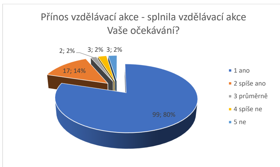
Graf č. 1 Přínos vzdělávací akce