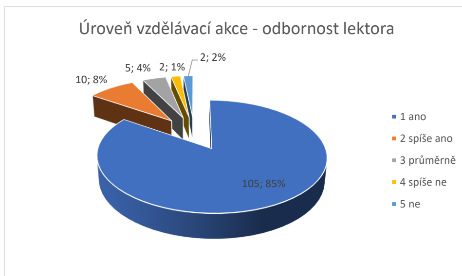
Graf č. 2 Úroveň vzdělávací akce