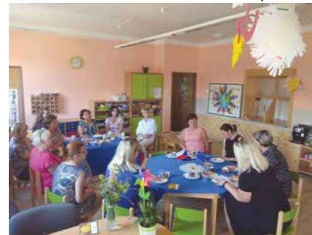
Setkání ředitelky a vedoucích učitelky MŠ