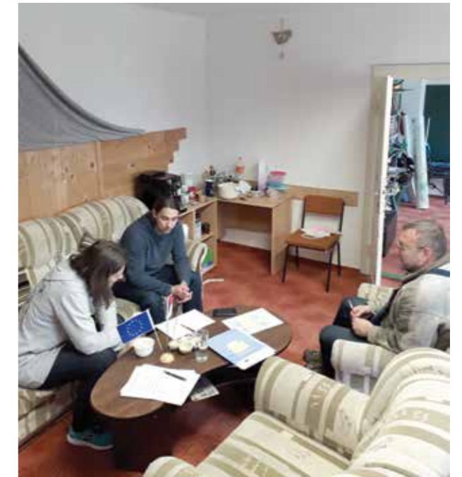
Pracovní skupina pro matematickou gramotnost