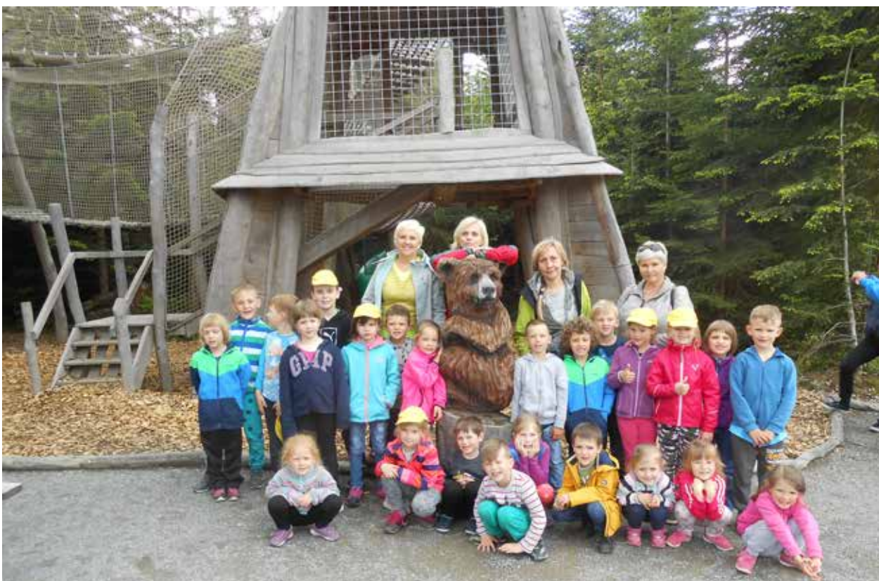
Děti z MŠ Nové Hradky v Království lesa na Lipně

Období školního vyučování ve školním roce 2020/2021 začne v úterý 1. září 2020 .