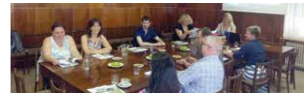
Řídící výbor - červen