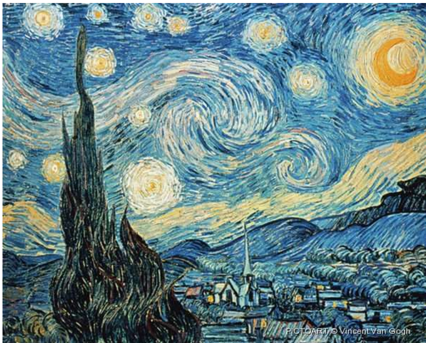
Vincent van Gogh – Hvězdná noc, olej na plátně, 1889